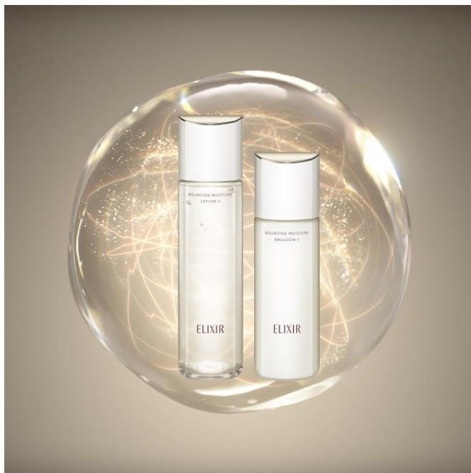
エリクシール リフトモイスト ローション SP (医薬部外品)