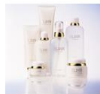
エリクシール エッセンスウォーター