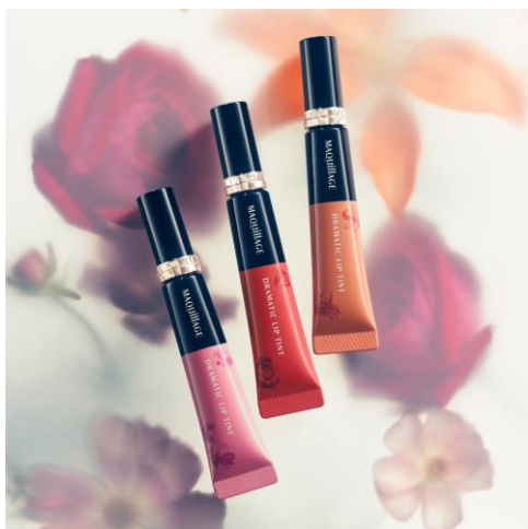
マキアージュ ドラマティックリップテイント

※ 6 時間仕上がり持続(色・つや)データ取得済み(当社調べ。効果には個人差があります。)