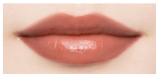
BR313 テラコッタリリージャム 肌なじみのよい ヌーディーブラウン