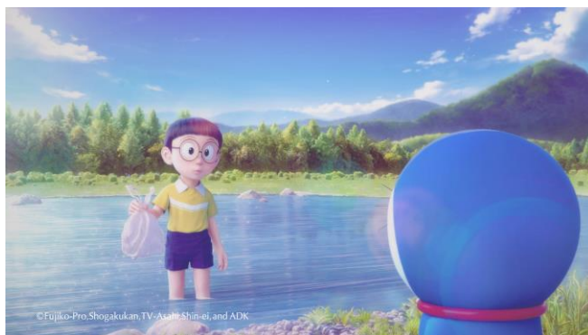
「22世紀からのメッセージ Vol.1ープラスチックごみはどこへ？」篇

スペシャルムービー公開先： https://www.shiseido.co.jp/elixir/sustainability/ （ブランドサステナビリティページ内）