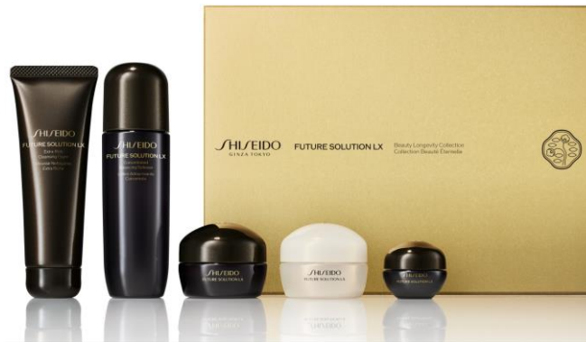
SHISEIDO フューチャーソリューション LX ビューティー ロンジェビティ コレクション