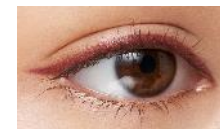
PK715 モーヴピンク 「いちご園」