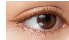
BE716 カーキベージュ 「葉脈」