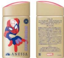
スパイダーマンパッケージ

日本では「スパイダーマン」「ヒーロー集合デザイン」「ブラックウイドウ」の全 3 品を発売し、「ブラックウイドウ」パッケージは日本限定展開となります。「ヒーロー集合デザイン」パッケージ裏面には、小さなヒーロー「アントマン」のデザインが”実寸大サイズ”で 2 パターン描かれており、どちらが入っているか外袋からは見えないため、開封してからの楽しみです。