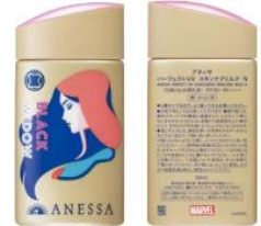
ブラックウイドウパッケージ