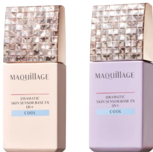
マキアージュ ドラマティックスキンセンサーベース EX UV+ クール

※ 当社調べ(web調査, 2020/10、ベースメイク使用者、n=500 20-69歳女性)