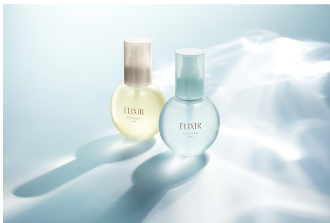
左:エリクシール シュペリエル つや玉ミスト