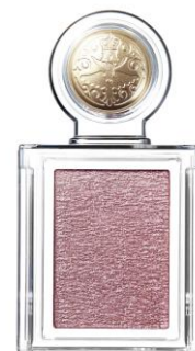
シャドーカスタマイズ PK321

色調開発は6月・7月の2日間で実施し、商品開発担当・研究員・資生堂メイクアップアーティストも加わり、12色のサンプルと10種のパール材を吟味しながらディスカッションしました。トレンドや実際に目もとに塗布した時の様子、使いやすさなどをふまえ、色調・パール剤の組み合わせが120通り以上ある中から3色のサンプル案を作成し、最終候補の2色に絞りました。参加メンバーは休憩時間を惜しんでサンプルのスウォッチ(色見本を実際の肌に塗って、色味や発色などを確認すること)に励むなど、「MAJOLICA PINK」への熱い想いが感じられました。最終の色調決定はマジョリカ マジョルカのファンクラブ会員投票を実施し、6,000名近くの投票の結果、赤みピンクにブルーパールが輝く色調案に決定しました。「華やかさと透明感を出せるパール感」「涙袋に乗せてもかわいく見える」ことなどにこだわった特別なピンク(PK321)です。