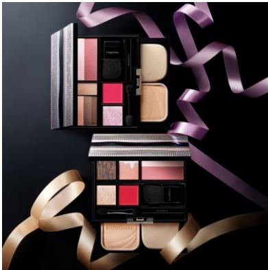
マキアージュ ドラマティックパレット