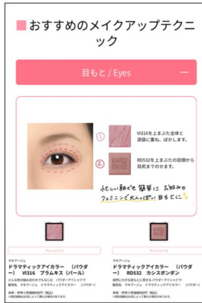
右: お客さま自身の顔写真にメイクアドバイスを記入(手書きも可能)