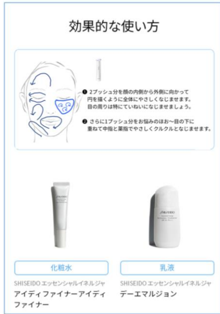
左: スキンケアプランの効果的な使い方