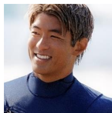
SHISEIDO BLUE PROJECT GLOBAL AMBASSADOR 五十嵐カノア

2020 年には、サステナブルな活動や製品開発を通じて、ビューティーカンパニーならではの社会価値を創造するグローバルプロジェクト「Sustainable Beauty Actions (サステナブル・ビューティー・アクションズ)」を宣言しました。「MOTTAINAI (リサイクルやリユース)」、「HARMONY (社会や環境との調和)」、「EMPATHY (おもいやり)」の 3 つの柱で構成し、サステナブルでより良い世界を実現するために、行動しています。