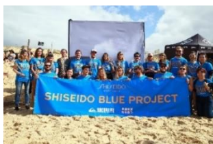
ビーチクリーン活動

【SHISEIDO BLUE PROJECT 特設サイト】 https://brand.shiseido.co.jp/shiseidoblueproject.html