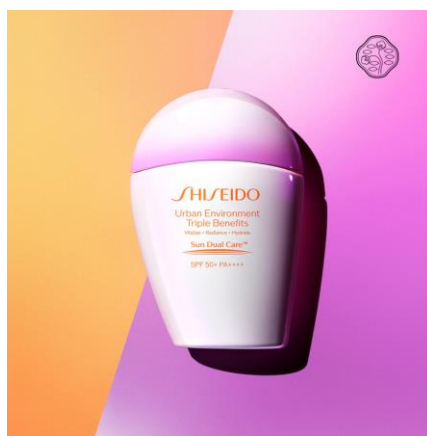
SHISEIDO アーバン トリプル ビューティ サンケア エマルジョン