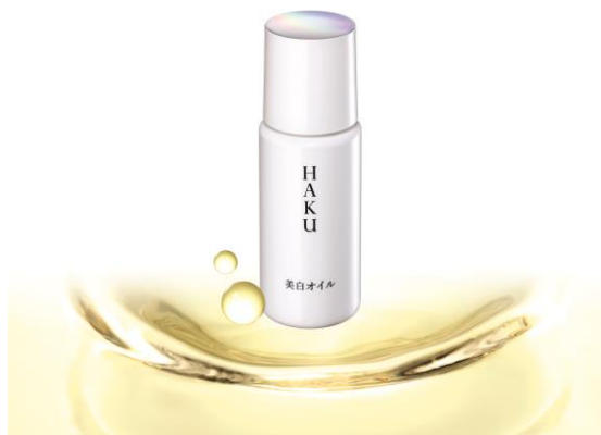
【HAKU 薬用 美白オイル】