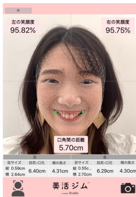
図 2: 美活ジムアプリ(使用画面の一例)