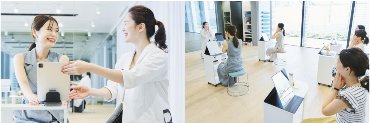
図 3: 美活ジムレッスン風景(イメージ)

「美活ジム」は、資生堂研究員が開発した研究結果に基づく肌と表情のためのプログラムです。横浜・みなとみらいにある S/PARK で、一般のお客さま向けに開催しています。美活ジムでは、研究員やビューティーコンサルタントが講師を務め、スキンケアの基礎から表情のケア、その土台となる顔のセルフエステや表情筋のトレーニング方法、さらには笑顔の作り方など、一生役に立つ肌・顔のお手入れ方法や知識をお伝えします。昨年 10 月よりサービスを開始しており、5 回目となる 7 月 17 日(土)のレッスンから、この「美活ジムアプリ」をレッスンに活用していきます。