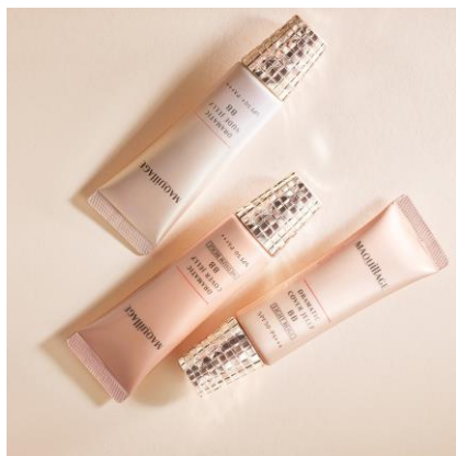
マキアージュ ドラマティック カバージェリー BB

※ 汗や水に強いカバー成分が肌に均一に密着し薄れにくくなるためのキ成分(ジステアリルジモニウムクロリド、合成金雲母、(PEG-240/デシルテトラデセス-20/HDI)コポリマー、DPG・BG・グリセリンから選ばれる多価アルコール)の選択が世界初である。先行技術調査およびMintel社データベースを用いた資生堂調べ(2020年10月)