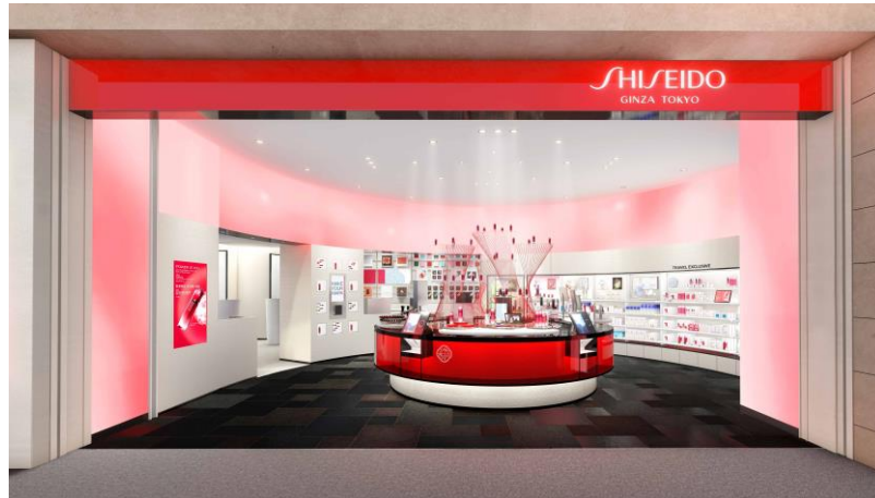
「SHISEIDO HANEDA BOUTIQUE」店舗外観

資生堂は、化粧品の開発・企画及び日本国内空港免税店等での化粧品販売を行う子会社である株式会社ザ・ギンザを通じて、世界 88 の国と地域で展開するブランド「SHISEIDO」の単独店舗「SHISEIDO HANEDA BOUTIQUE」を、羽田空港旅客ターミナルを運営する日本空港ビルデング株式会社、東京国際空港ターミナル株式会社と、羽田空港第3ターミナル国際線出発エリア内に、7月23日(金)にオープンします。