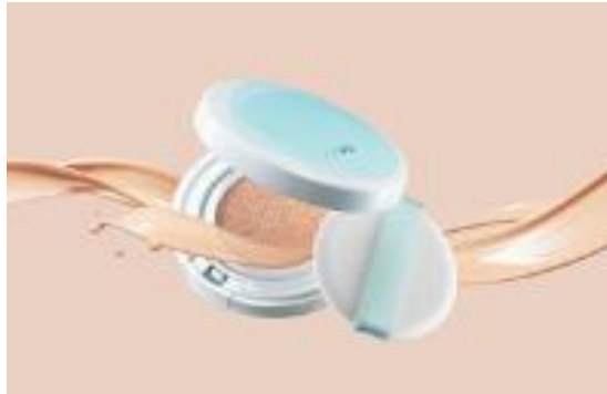
HAKU ボタニック サイエンス 薬用 美容液クッションコンパクト(医薬部外品) 〈販売名:HAKU エッセンスF オークル 10 オークル 20 オークル 30 ピンクオークル 10〉

※3 保湿成分として:ルムプヤンエキス、ユキノシタエキス、シロバナイゴウゾリナ葉エキス、甜菜由来ベタイン、トウキ根エキス、オタネニンジン根エキス、植物由来グリセリン