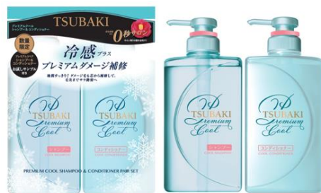
【TSUBAKI プレミアムクールポンプペア】

また、地肌のべたつきや髪の紫外線ダメージなど夏ならではの悩みもケアし、気持ちの良いクールな使用感で、毛先までサラサラの艶髪を叶えます。