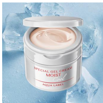
アクアレーベル スペシャルジェルクリーム N（モイスト）クール

※2（うるおい保持成分）D-グルタミン酸、D-アスパラギン酸、DL-アラニン、DL-メチオニン