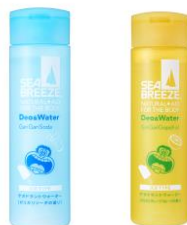
【シーブリーズ デオ&ウォーター I（医薬部外品） 左:ガリガリソーダの香り 右:ガリガリグレープフルーツの香り】

つけた瞬間、すーっと爽快さらさら肌を叶える「シーブリーズ デオ&ウォーター」は、汗とニオイをおさえて、集中したい時やスッキリしたい時などキモチの切り替えにも使える、制汗デオドラントウォーターです。その中でもクール感の強いデオ&ウォーターのアイスタイプから、ガリガリ君のアイスの香り「ガリガリソーダの香り」と「ガリガリグレープフルーツの香り」の全2種類を発売します。