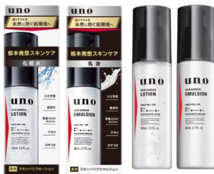
【ウーノ スキンバリアローション(医薬部外品)/ウーノ スキンバリアエマルジョン(医薬部外品)】

※2 緑茶エキス(整肌・保護)、チオタウリン・グリセリン(保湿)、タマリンドガム(うるおい保護)