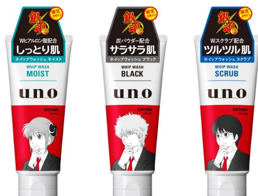
左から「ウーノ ホイップウォッシュ(モイスト)神楽」 「ウーノ ホイップウォッシュ(ブラック)銀時」 「ウーノ ホイップウォッシュ(スクラブ)新八」