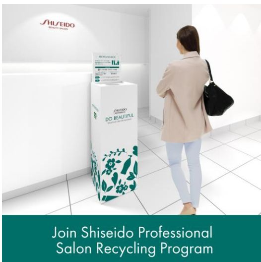
【店頭に設置される回収ボックスのイメージ】

https://salon.shiseido.co.jp/news/p20201222_8923/