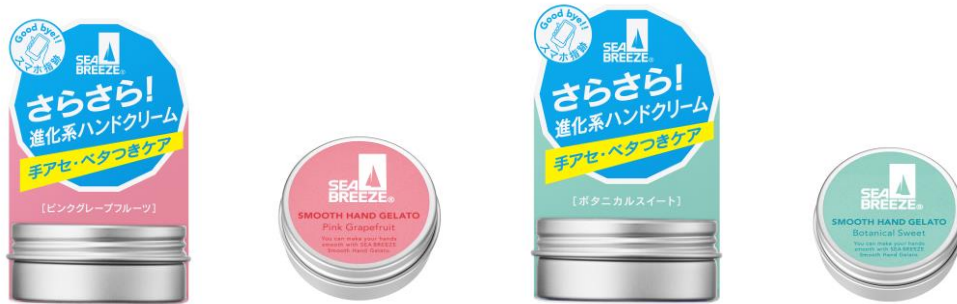
【シーブリーズ スmoothハンドジェラート】