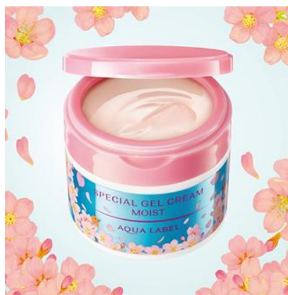
アクアレーベル スペシャルジェルクリーム N (モイスト) S

※4 (うるおい保持成分) D-グルタミン酸、D-アスパラギン酸、DL-アラニン、DL-メチオニン