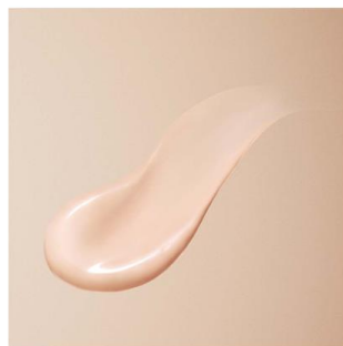
マキアージュ ドラマティック ヌードジェリー BB