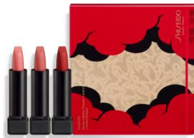
モダンマット パウダーリップスティック ミニセット リミテッド エディション