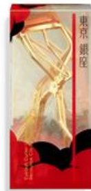
アイラッシュ カーラー リミテッド エディション