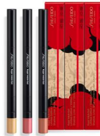
カジャール インクアーティスト リミテッド エディション