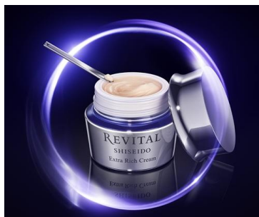
リバイタル エクストラリッチクリーム(医薬部外品)

※4 インテージ SLI スキンケア市場 19年8-20年7月 クリーム年齢別購入率