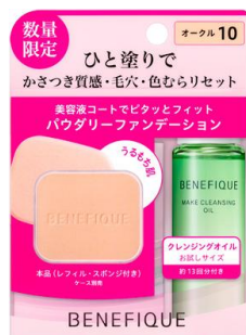
ベネフィック ファンデーションジーニアス(パウダリー)限定セット DC