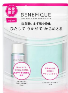
ベネフィック リセットクリア トライアルセット ミニN