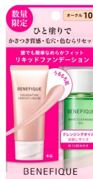
ベネフィック ファンデーションジーニアス(リキッド)限定セット DC

※お客さまからのお問い合わせは「資生堂お客さま窓口 フリーダイヤル 0120-81-4710」でお受けしています。