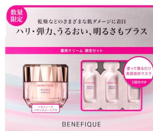
ベネフィック バウンスジーニアス 限定セット