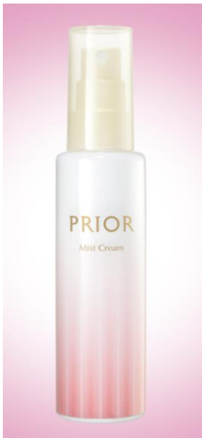
プリオール おでかけミストクリーム

「プリオール」は、秋冬の過酷な乾燥シーズンにおける大人の女性の肌意識と美容行動に着目しました。スキンケア直後の肌状態の満足度は高いものの、夕方にかけて時間が経つと、鏡を見た時の小じわの目立ち、ハリなさ、肌の乾きを感じるため、通常は夜のスキンケアで使用するクリームを日中も持ち歩いたり、夜のクリーム使用者が増加することを捉えました。極度な乾燥をすぐにケアしたい大人の女性のニーズに応え、ミスト状クリームを発売します。