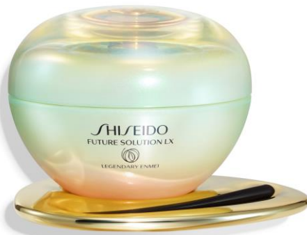
レジェンダリーEN クリーム