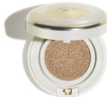
トータル R クッション e