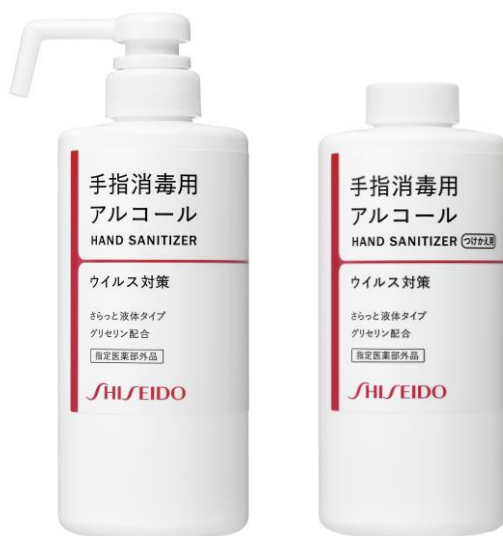
左)S 手指消毒用エタノール液 右)S 手指消毒用エタノール液(つけかえ用) (ともに指定医薬部外品)

https://corp.shiseido.com/jp/sustainability/community/support/