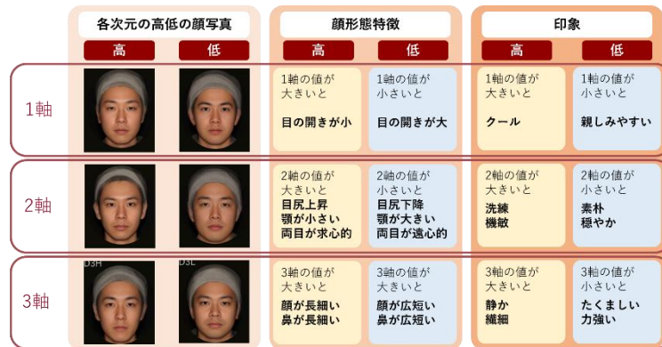
図2: 3つの軸の合成顔と顔形態特徴および紐づく印象

男性の顔立ちは3つの軸で表すことができ、それぞれの顔形態特徴が与える印象には違いがある。