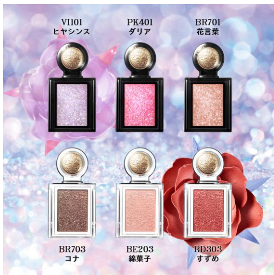
マジョリカ マジョルカ (上段)シャドーカスタマイズ(フローティング) 全3色 (下段)シャドーカスタマイズ 新3色

SNSで話題の既存色を含めた全24色で、今まで以上に自分にぴったりのカラー・質感・発色で大きな瞳が手に入るラインナップを展開します。