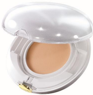
エリクシール シュペリエル つや玉ファンデーション T

多くのお客さまが「つや玉のある肌になりたい」一方で、「ファンデーションで悩みを隠そうとすると「つや玉」が隠れてしまう」といった悩みがあることを捉え、2018年10月に「エリクシール シュペリエル つや玉ファンデーション」を発売しました。発売後、“自然にカバーしながら、「つや玉」輝く”と高く支持されています。