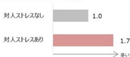
【皮脂分泌量測定実験結果】※相対値

そんな時は、メイクの上からでも使えるミスト状コスメで、瞬時にリフレッシュして、肌の保湿バランスを整えましょう。ミスト状コスメは、保湿効果に加え、汗や皮脂によるベタつきを抑えたり、メイクを定着させ崩れを軽減させ気分をリフレッシュさせるなど、さまざまな効果が期待できます。お好みや目的に合わせて選びましょう。