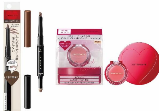
【インテグレート 左:ナチュラルステイアイブロウ 右:水ジェリークラッシュ 特製チークセット II】

販売チャネルは、ドラッグストア・GMS・化粧品専門店など約17,000店です。併せて資生堂の総合美容サイト「ワタシプラス」でも販売します。