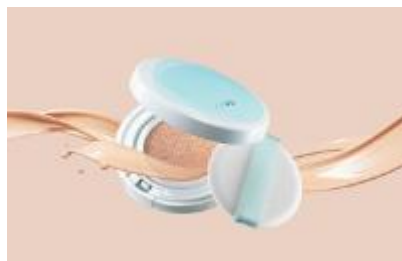
HAKU ボタニック サイエンス 薬用 美容液クッションコンパクト(医薬部外品) 〈販売名:HAKU エッセンスF オークル 10 オークル 20 オークル 30 ピンクオークル 10〉