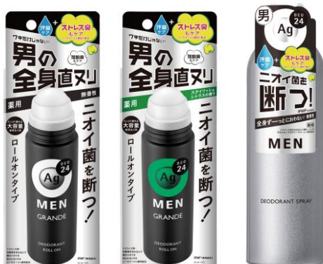
【エージーデオ24メン 新デオドラント (医薬部外品)】