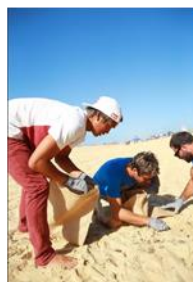
アンバサダーの五十嵐カノア選手も参加、ビーチクリーン活動