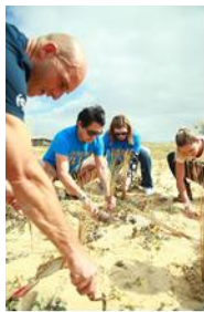
ビーチを守る植樹活動 「Dune Planting」

SHISEIDO は、2020 年以降も引き続き WSL 主催の大会に協賛を行い、WSL、PURE とともにビーチクリーン活動や植樹活動などを続けていきます。