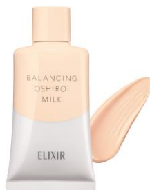
エリクシール ルフレ バランシング おしろいミルク C

※2エリクシール ルフレ バランシング おしろいミルク 2018年3月～2019年12月までのメーカー累計出荷実績