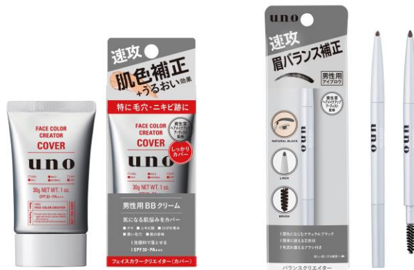
【左:ウーノ フェイスカラークリエイター(カバー)/右:ウーノ バランスクリエイター】

※4 資生堂調べ「男性メイクに関するアンケート」(2019 年 10 月)20～50 代 男性 n=439