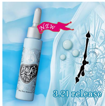
マジョリカ マジョルカ ポアレスフリーザー