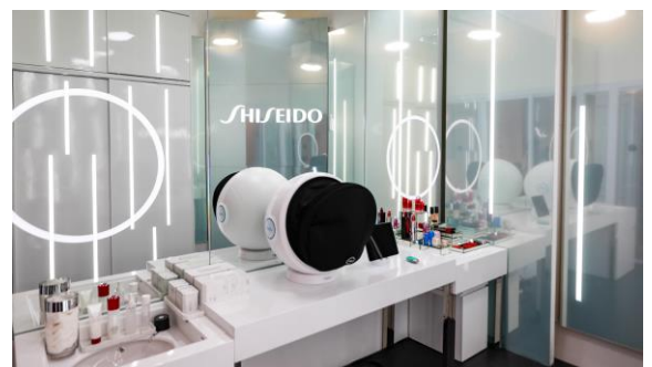
お客さまの試用スペース