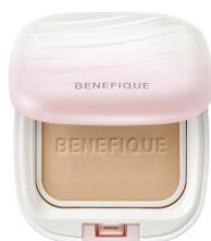
ベネフィーク ファンデーションジーニアス (パウダリー)

ベネフィークは、女性の疲れと肌に関する意識に着目しています。疲れを感じている女性の化粧下地やファンデーションを使用するときの悩みは「化粧のりの悪さ」、「毛穴が目立つ」、「化粧が落ちやすい・崩れやすい」、「顔色の悪さやトーンダウン」、期待することは「疲れて見える状態をしっかりカバーして、キレイに見せる」、「仕上げた状態を長時間キープできる」、「肌へのスキンケア効果」であることを捉えました。