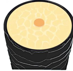
すこやかな髪の断面図