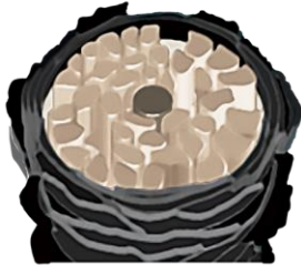
ダメージを受けた髪の断面図

すこやかな髪は内側にはタンパク質や脂質が隙間なく詰まっており、表面はキューティクルがきれいに揃っていることで、髪の断面はまるで「真円(しんえん)」のような形状です。そのため光が正反射し、艶やかで指で触れるとなめらかな感触です。一方、ダメージを受けた髪は内側からタンパク質と脂質が流出し、表面はキューティクルがはがれる、先端が欠ける、めくれるなどデコボコした状態のため光が乱反射し艶やかに見え、また手で触れてもごわつきやきしみなど指通りの悪い感触になります。