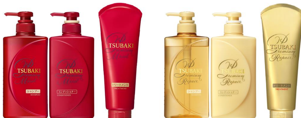
TSUBAKI プレミアムモイストライン