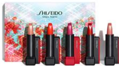
ホリデーカラーズ ミニリップブーケ