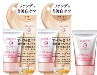
純白専科 すっぴん美容液ファンデュ (医薬部外品)

※3 美白化粧品は、メラニンの生成を抑え、シミ・そばかすを防ぎます ※4 トラネキサム酸