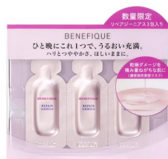
【ベネフィーク リペアジーニアス 3P】

「ベネフィーク リペアジーニアス」は、リペアコンセントレート成分※1配合の濃密な美容液がマスクのように肌を密封し、集中ケア。ダメージを積み重ねがちな肌に、うるおいとともに曇りのない透明感となめらかさを与え、化粧のりのよい肌へと導きます。また、ピコモイスター技術と潤環美容成分※2を搭載し、角層のすみずみまで美容成分を浸透させ、うるおい環境を整え、美しさを引き出します。夜の「タイムチューン」※3にも着目。「お疲れさま」のあなたに心地よいリセットタイムをサポートするスペシャルアイテムです。