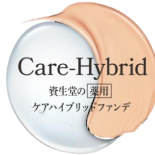
資生堂「薬用 ケアハイブリッドファンデ」ロゴ

資生堂は、「ファンデーションをつけている年 3,500 時間※ 1 が素肌をキレイにする」という新しい美容習慣を、「薬用 ケアハイブリッドファンデ※ 2 」を通じて、2019 年 3 月 21 日(木)より複数のブランドで展開します。